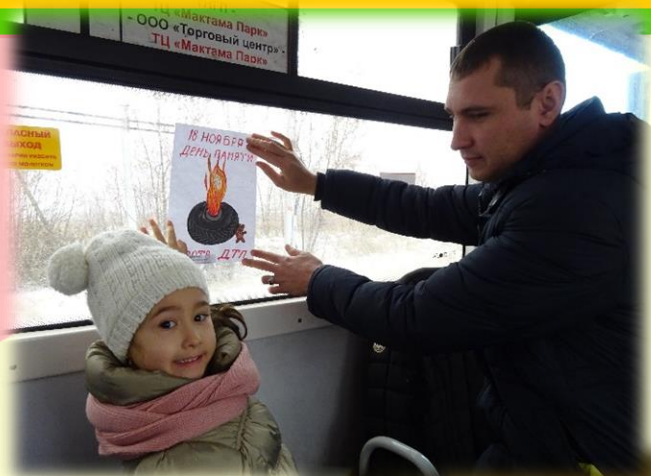
«ВОЗЬМИ РЕБЕНКА ЗА РУКУ»