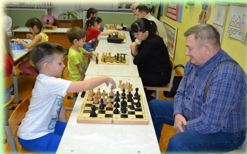
«ИГРАЕМ В ШАХМАТЫ»