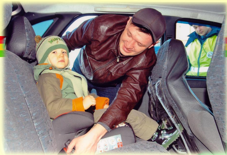
«РЕБЕНОК – ГЛАВНЫЙ ПАССАЖИР!»