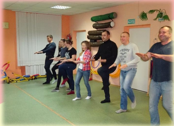
«ЗАРЯДКА ДЛЯ РОДИТЕЛЕЙ»